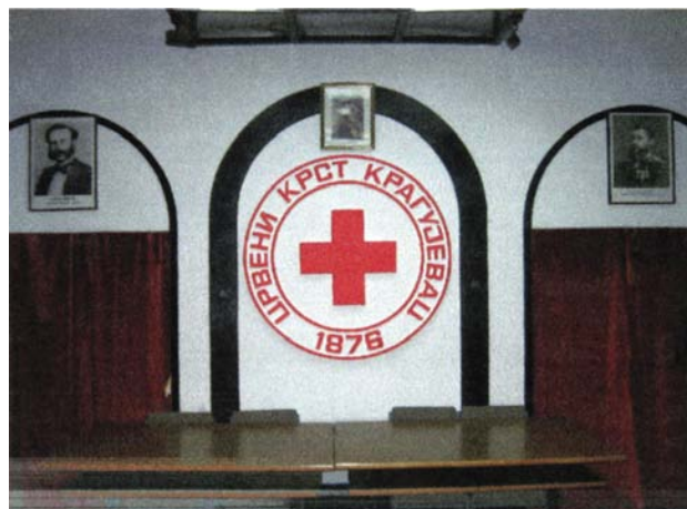
Slika 16: Crveni krst Kragujevac

Navedeni ugledni lekari, volonteri Crvenog krsta Kragujevca su bili predvodnici plejade kragujevačkih lekara koji su dali krupan doprinos poboljšanju zdravlja svoga naroda, dostojan verifikacije istorije lekarstva ovog kraja. Takođe, predstavljaju snažnu inspiraciju mlađim kolegama, članovima Crvenog krsta u ostvarivanju aktuelnih projekata unapređenja zdravlja građana centralnog dela Šumadije.