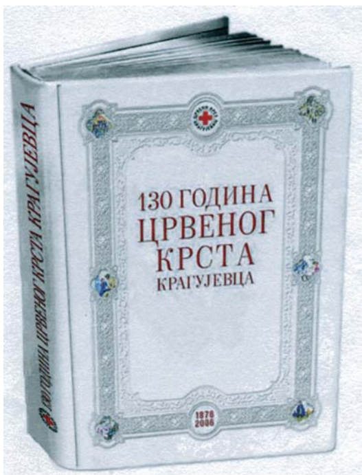
Slika 1: Monografija 130 godina Crvenog krsta Kragujevca završetka II svetskog rata pa do danas, moći da afirmišemo samopregalački rad niza ovdašnjih lekara i takvom konkretizacijom, zaokružiti ono što je Monografijom dato i što je kapitalnim delom "Istorija kragujevačke hirurgije", profesora dr Zorana Matovića inicirano (slika 3, slika 4).

Ipak, ne čuditi što tako veliki broj doktora medicine, angažovanje u Crvenom krstu smatra jednako vrednim kao i svoj svakodnevni plemeniti posao.