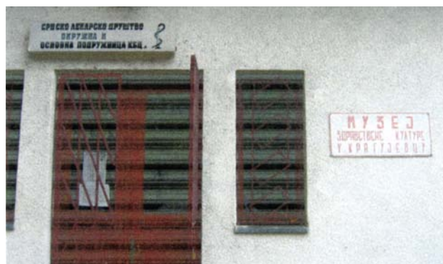
Slika 3: Muzej zdravstvene kulture

Jer, i u komisiji koja je 17. februara 1863. godine usvojila ime "Međunarodni komitet za pomoć ranjenicima" u Ženevi, su bila i dva lekara: Luj Api i Teodor Monoar, ali i 13 godina kasnije, u malenoj Srbiji, glavni inicijator osnivanja Društva Crvenog krsta i pisac njegovog Statuta bio je dr Vladan Đorđević (slika 5), onaj isti ugledni lekar koji je učestvovao u stvaranju Srpskog lekarskog društva, i radio kao njegov sekretar.