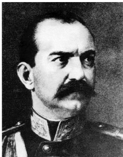
Slika 6: Kralj Milan Obradović