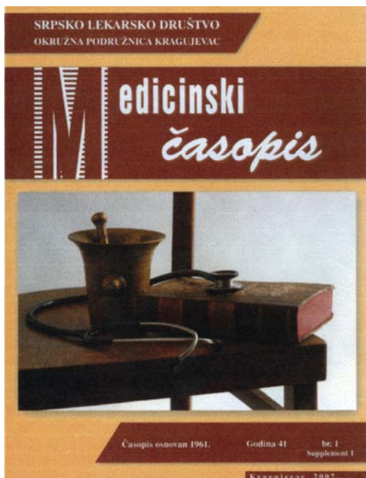
Slika 2: Medicinski časopis

Ipak, ne čuditi što tako veliki broj doktora medicine, angažovanje u Crvenom krstu smatra jednako vrednim kao i svoj svakodnevni plemeniti posao.