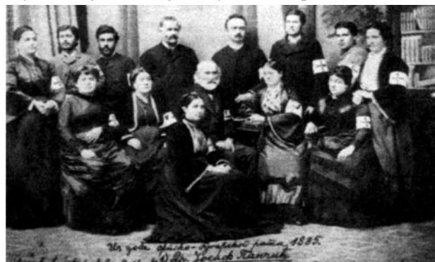
Slika 8: Josif Pančić, lekar i naučnik kojim su se Kragujevčani ponosili

Istakli bismo, ipak, veliku pomoć mnogih stranih misija, o kojima je mnogo pisano, ali najdublja osećanja Kragujevčani i danas gaje prema dr Elizabeti Ros, koja je u svom trudu oko naših bolesnika, i život ovde ostavila. Sahranjena je na starom gradskom groblju, čiji spomenik održava Crveni krst Kragujevca i koji svake godine organizuje svečani pomen.